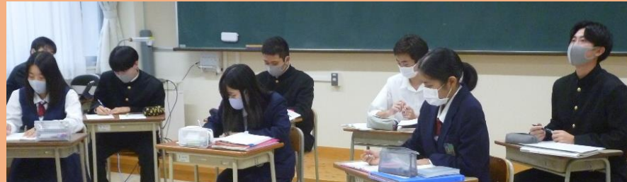
現役大学生の意見は貴重なので、真剣にメモを取りました。