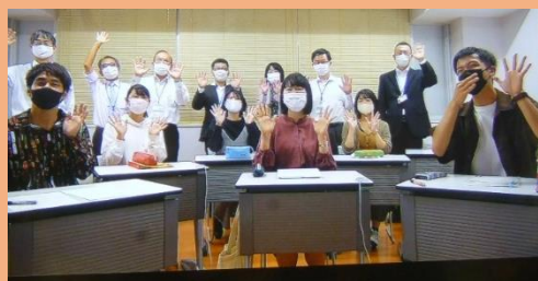
画面の向こうの岡山大学の方々と共に最後に記念撮影