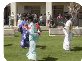
17年度 派遣 日本舞踊の紹介

2年生10名のSPA派遣生徒が決定しました。3月の出発に向けて、研修プログラムもスタート。課外時間に英会話、ヒヤリングの練習、フォトアルバムの制作、日本文化や学校紹介の準備、パーティでの出し物の計画など3月21日の出発に向けて、研修を重ねています。