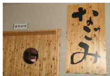
「なごみ」 看板と部屋の扉

県教育庁教育次長・財務課・総務課、森の大使、設計・施工に関わった方々をお招きし、1,2年の各ホームルーム委員、リビングデザイン選択者、生徒会役員、吹奏楽部員参加により、完成記念式を開催しました。来賓の方より心温まる御祝辞、リビングデザイン選択者による経過説明、吹奏楽部による演奏会。木材の町勝山にふさわしい木の温もりと完成の喜びをあわせて感じることのできる記念式典となりました。