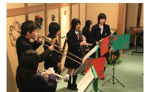
クリスマスミニコンサート

12月3日吹奏楽部によるウインターミニコンサートが開催されました。クリスマスにちなんだ曲など10曲を演奏して来場者60人から大きな拍手をいただきました。サンタクロースの衣装をまとい、来場者にプレゼントを贈る場面もありました。また、16日から26日までは美術部・書道部合同作品展を開催。地元勝山の町並み保存地区の風景画など多彩な絵画、好きな言葉や詩、俳句を個性的な筆遣いでつづった書を披露しました。