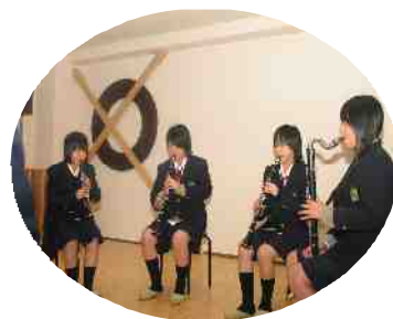
吹奏楽部による ミニ演奏会