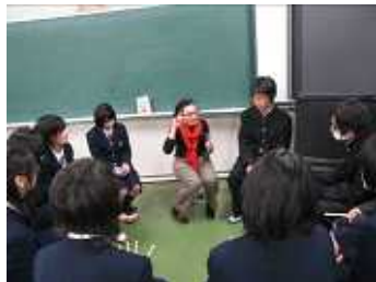
英会話のレッスンの様子

今年度最終の「岡山アダプト事業」参加の清掃活動が行われました。年4回のうちの最終回は、学年末考査の最終日でした。生徒会役員を始めとして、各部の部員、有志メンバーが参加し総勢約40名が清掃活動に従事しました。玄関前に集合した後、勝山文化センターを出発点として旭川河原に沿って南へと清掃を行いました。この奉仕作業に対して、地域の方々からも、好評を得ているという話も聞いています。来年度もこの行事を続けて行い、日ごろからお世話になっている町の方々に少しでも喜んでいただけると幸いです。