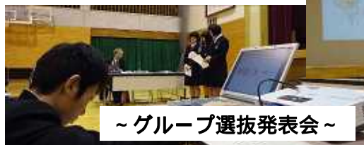
~グループ選抜発表会~