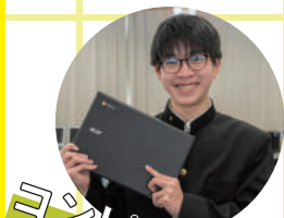
コンピューター部